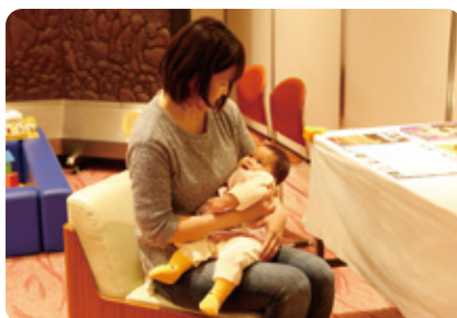
授乳スペース ② オープンスペースタイプと仕切られた半個室タイプを用意。同時に4名様まで授乳可能です。授乳クッションやぬいぐるみ等も用意しております。